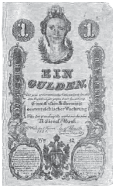
1 zlatý 1.1.1858 - falzum

V prosinci téhož roku bylo tamtéž zadrženo 6 kusů neuměle ručně malovaných padělků použitých k platbám. Jednu z bankovek obdržela o půl sedmé ráno prodavačka hus na trhu, další přijala prostitutka, která, podobně jako trhovkyně, nebyla schopna popsat muže, od něhož bankovku přijala. Policie upozornila občany na další možný výskyt tužkou kreslených falz se