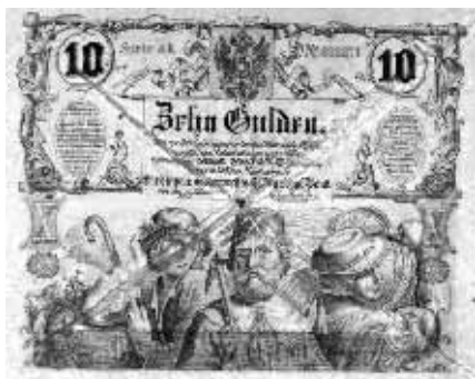
10 zlatých 15.3.1863 - falzum