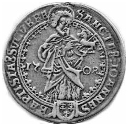
Revers guldineru se sv. Janem Křtitelem (foto aversu na titulní straně)